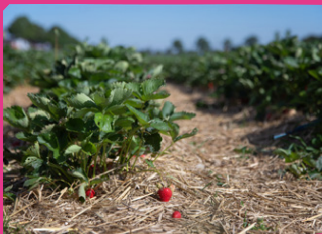
Erdbeerfeld in Nordrhein-Westfalen im Juni 2022