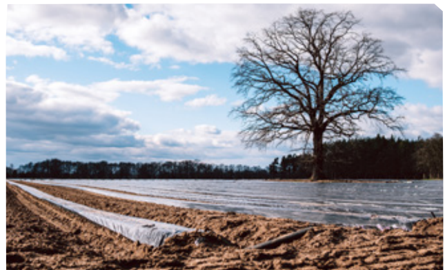
Mit Planen abgedecktes Erdbeerfeld in Vetschau, Brandenburg.

Branchenexpert*innen erläutern, dass gerade bei Erdbeeren einige vorwiegend kleine Betriebe aufgrund des enormen Preisdrucks in den vergangenen Jahren aus dem Geschäft mit dem Lebensmitteleinzelhandel ausgestiegen sind.